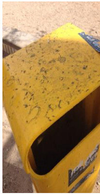
PARQUE LA PAZ