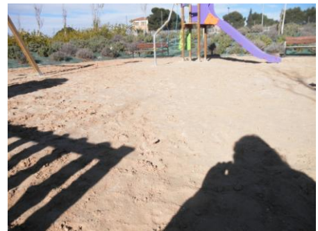
PROLONGACIÓN ALTA CABANILLAS, VALDEFIERRO