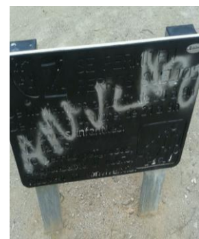
TORRERO ESC. JARDINERIA