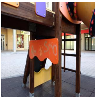
ROSALES DEL CANAL