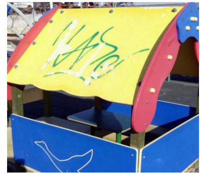
CORREDOR VERDE OLIVER