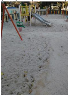
PLAZA MAYOR SAN JOSÉ