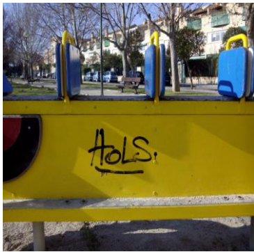
P. LOS OLIVOS