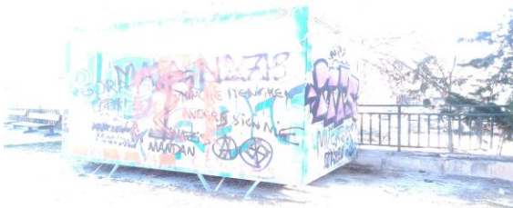
Parque de los Incrédulos