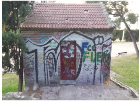
Parque Castillo Palomar