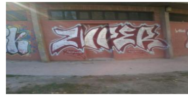
Parque Glorietas de Goya