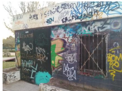
Parque la Granja