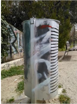
PARQUE LA GRANJA