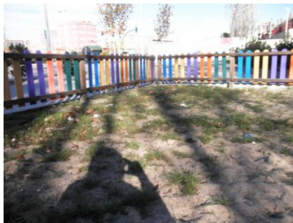
CARRETERA MADRID, VALDEFIERRO