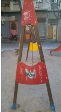
PL. NUESTRA SEÑORA DEL PORTAL