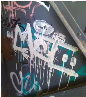
Parque la Paz