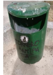
TORRERO, ES JARDINERIA